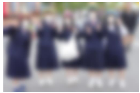
修学旅行（関西方面）