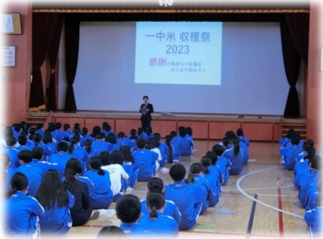
全校で収穫の喜びを分かち合いました