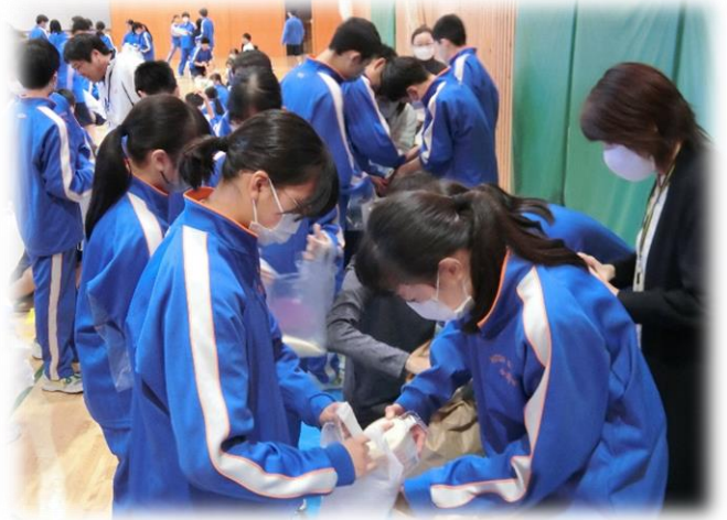
1人、約4合のお米が配られました