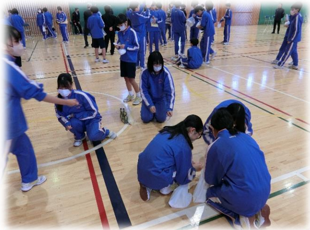
こぼれたお米もちゃんと拾います！